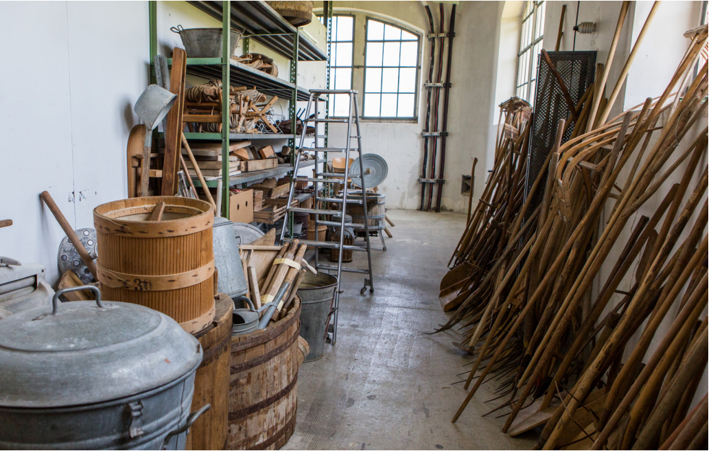
Réserve muséale à Mervelier