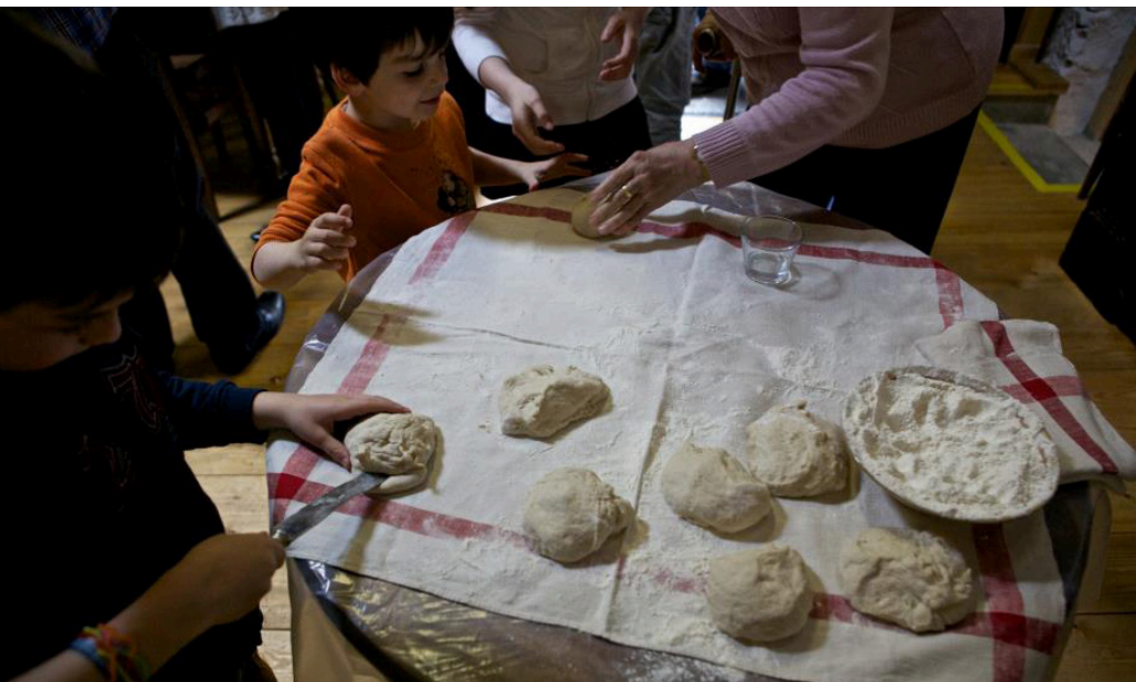
Visiteurs confectionnant leurs pains, beurre, puis leurs tartines