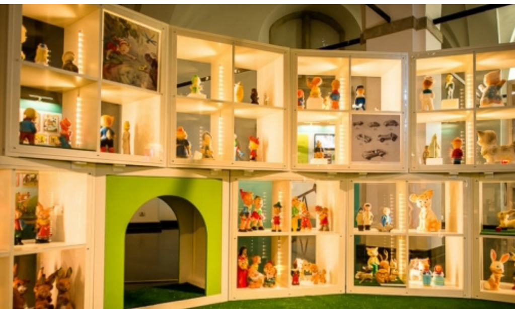
Objet du musée Chappuis-Fähndrich à la Porte de Hal à Bruxelles