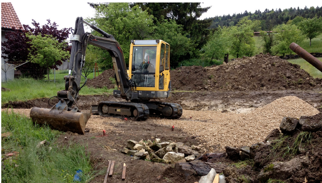
Travaux de terrassement en vue de la pose de deux containers