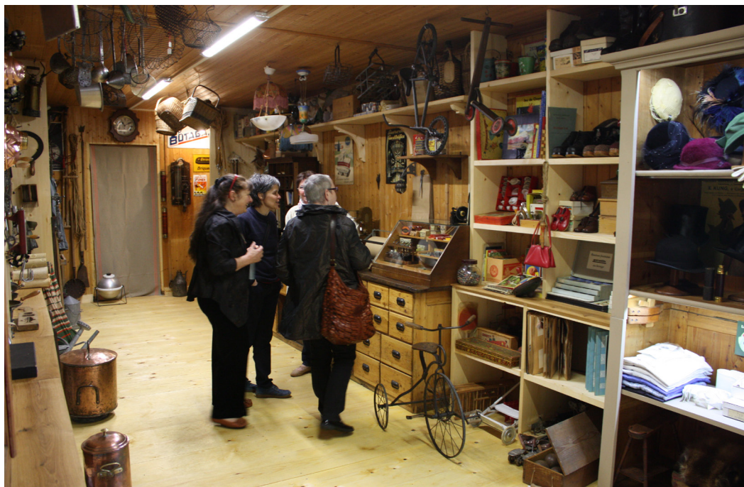
Visite du bazar jurassien à l'occasion de son vernissage

Enfin, toute la partie nord de l'annexe du musée a été entièrement vidée de son contenu et réaménagée dans le but d'agrandir les espaces d'exposition. Début mai, le public a été invité à découvrir le tout nouveau département, le bazar jurassien.