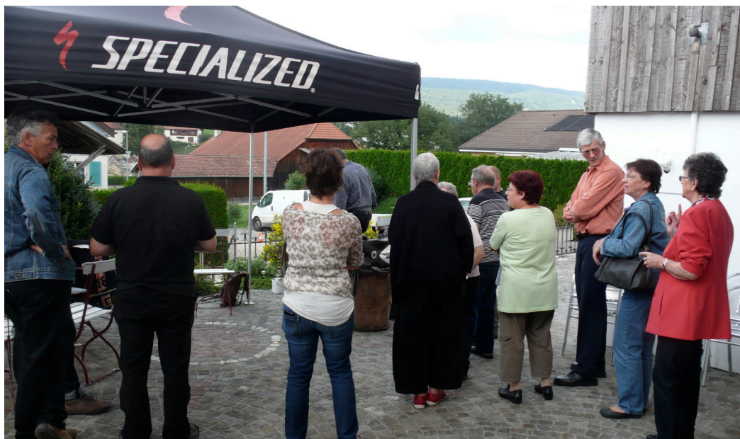
Fabrication de briquets de silex

En 2013, le Musée Chappuis-Fähndrich a accueilli 1'413 visiteurs. Ceci représente une augmentation de 406 visiteurs par rapport aux années antérieures et qui s'explique en grande partie grâce à la création de la Société des Compagnons du Musée Chappuis-Fähndrich qui a fourni un travail bénévole très important, notamment dans l'organisation des expositions temporaires, des ouvertures mensuelles et des animations, mais aussi en formant un groupe de guides.