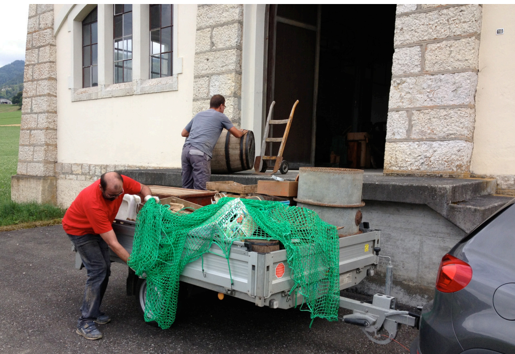
Déménagement des collections

Les objets déplacés ont été répartis dans « la bergerie », bâtiment situé en dessus du musée qui a été entièrement renové entre 2012 et 2013. Les objets lourds tels que fourneaux, machines agricoles et outils ont pris place sur des palettes et des étagères. D'autres objets ont été emmenés dans l'abri de la protection civile de Develier, mis gracieusement à disposition par la commune et dans le bâtiment des Forces Motrices Bernoises (BKW) à Mervelier.