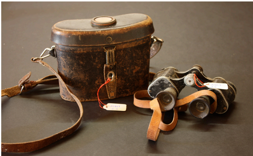
Objets inventoriés et photographiés pour la base de données du musée

Enfin, le mandat d'inventorisation comprend encore différents travaux qui concernent la manutention des objets. Afin de mener à bien cette charge, différents espaces de stockage ont été aménagés.