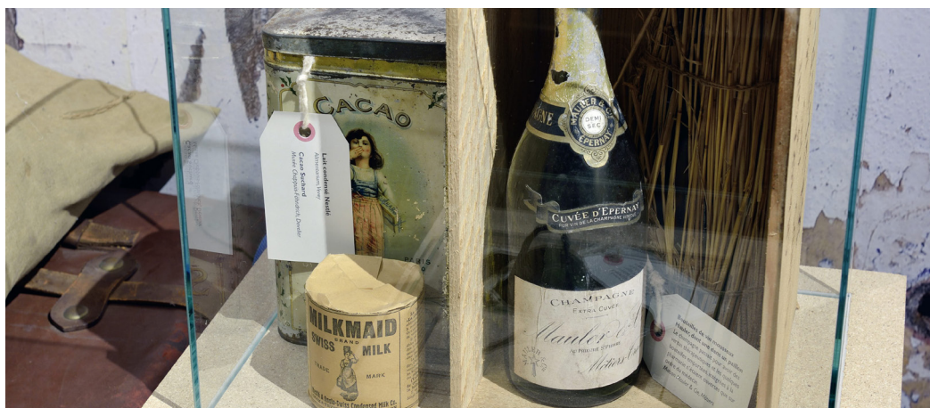
Les objets du MCF pour l'exposition « K2, échec en Himalaya »