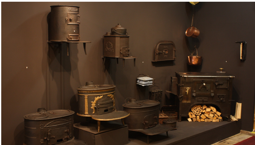
Détail de l'exposition temporaire « Histoire d'avoir chaud »

Puis, les visiteurs découvrent différents fourneaux - à charbon, à essence, à électricité - tous plus beaux les uns que les autres, séduisants par leur douce simplicité. Une exposition où revivent, l'espace d'un instant, d'ingénieux stratagèmes inventés par l'homme.