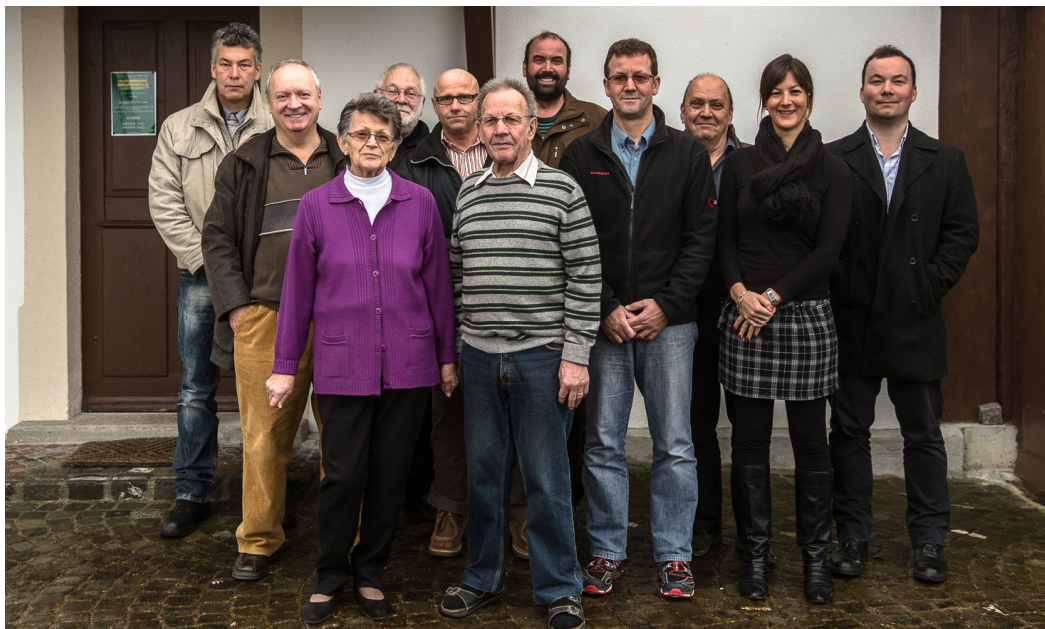
Membres de la Fondation du Musée Chappuis-Fähndrich

Le Conseil de fondation aura pour but d'assurer la continuité du travail accompli par les fondateurs et la famille. Garantir la pérennité de la collection, la conserver en un ensemble afin de préserver sa valeur historique est la mission principale de la fondation. Il s'agira tout d'abord de mettre en valeur les objets de la collection, de les maintenir en bon état et de les présenter au public.