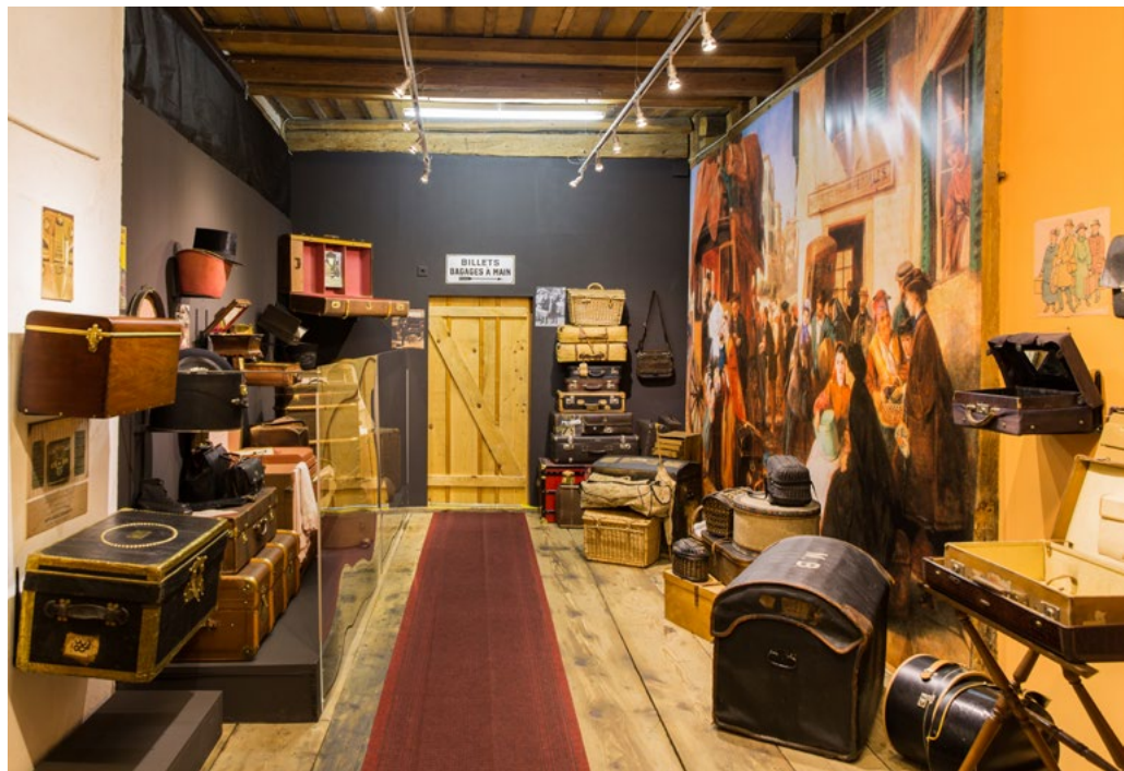
L'exposition temporaire « DE LA MALLE VUITTON AU BALUCHON »

L'horloge d'église ainsi que le carillon ont été officiellement présentés en juillet. En août, les visiteurs ont pu confectionner une pochette «de voyage» utilisant d'anciennes cartes fatiguées. Le 6 septembre était consacré à la réalisation d'un furoshiki «baluchon japonais». Le furoshiki est une technique japonaise qui permet de réaliser toutes sortes de sacs et d'emballages à partir d'un carré de tissu plié et noué. Un moyen élégant de s'initier à ce joli moyen de supprimer les sacs plastique.