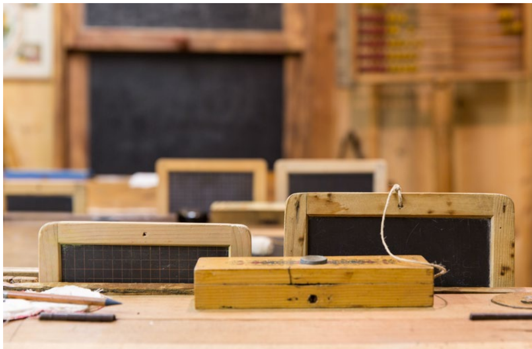
L'école (C) MCF