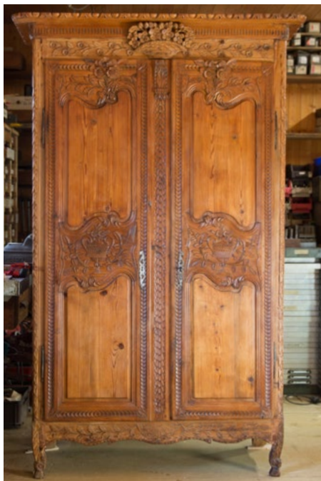
Une armoire de mariage

Une armoire de mariage en mélèze provenant de Delémont, datant des années 1800, soit de l'époque où le Jura était rattaché à la France. Il s'agit d'un meuble assez rare avec ses symboles sculptés des fiançailles, du mariage, du couple et de la famille.