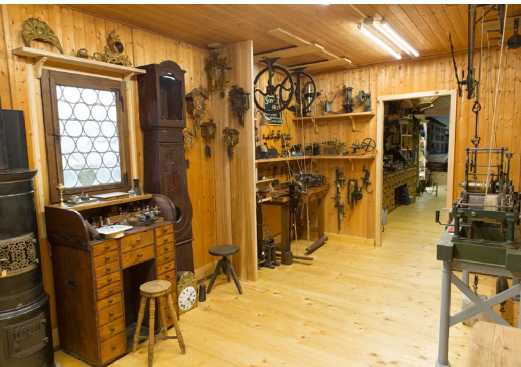
Le département de l'horloger

Enfin, quelques petits travaux de finition ont été apportés à l'horloge de clocher présentée en 2014. Elle marche, elle tourne, elle sonne et marque les heures. Moyennant un petit réglage de temps en temps ainsi que le possible remplacement d'une corde, plus quelques gouttes d'huile là où il faut, et là voilà repartie pour un siècle.