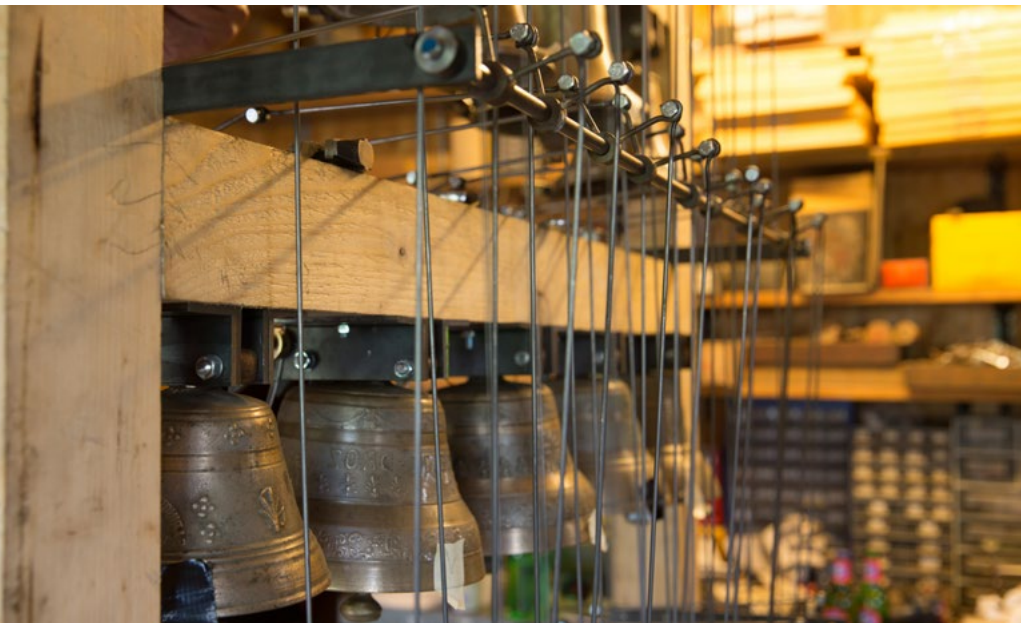
Les cloches du carillon

tant que témoin muet de collection. Au musée, une question s'est donc posée: sous quelle forme présenter et faire entendre les cloches de chez nous? Pourquoi ne pas les rassembler en un chœur sous la forme d'un carillon? L'origine de cet instrument qui n'est pas présent dans le Jura remonte à la nuit des temps. Ce faisant, le visiteur aurait devant lui «ses» cloches de vaches activées mécaniquement par tambour ou par clavier. C'est donc sous cette forme qu'il a été décidé de construire un carillon. On dit que c'est le premier pas qui compte. Ce premier pas a été fait, suivi de beaucoup d'autres et ça continue grâce au bénévolat habituel. Il y a dans ce musée