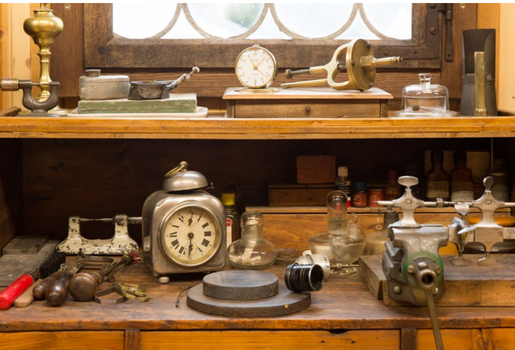
L'établi de l'horloger