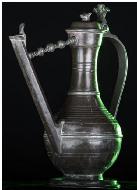
Une channe bernoise en étain du XVIII e siècle

Les anciens se souviennent certainement de la ravigotante chanson de Pierre Dudan «par la fenêtre on entend les cloches des vaches dans les champs». C'était le beau temps où nos villages