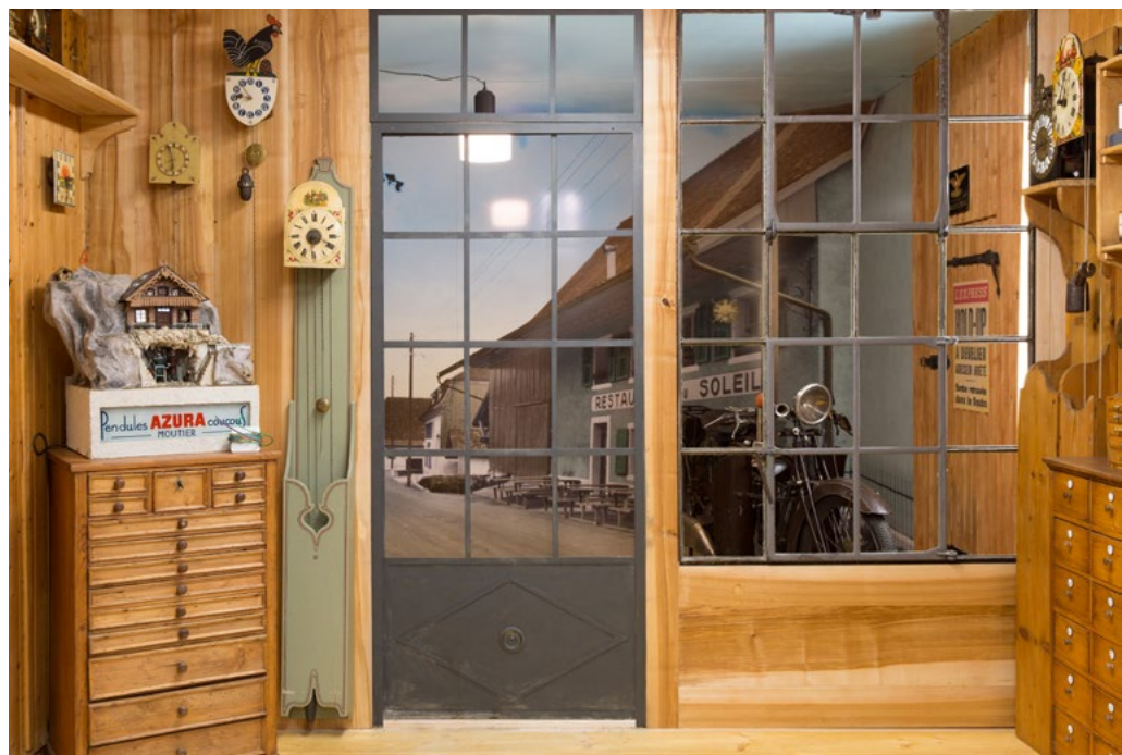
La place du Restaurant du Soleil à Develier