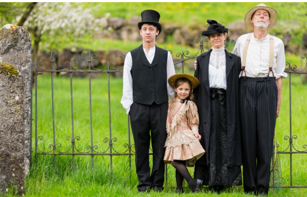
Défilé «prêt à porter»

malles, de valises et autres contenants indispensables aux voyageurs courageux et intrépides, curieux ou en déplacement par nécessité du temps des diligences, des paquebots, des premières automobiles et chemin de fer. La liste de ces contenants d'antan est incroyablement variée et adaptée à la condition du voyageur.