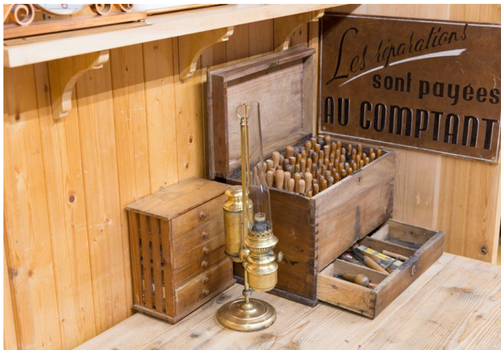
Les outils de l'horloger © MCF

L'échoppe de l'artisan horloger a été complétée par un apport de métiers annexes et leurs outils tels graveur, boîtier ou marqueur en cabinet d'horloges. Des centaines de burins et ciseaux accompagnent les marteaux, tas à frapper et bien d'autres outils. Un ensemble qui ne prend pas beaucoup de place sur l'établi mais qui atteste d'un époustouffant savoir et tours de main pour assurer le fini des montres et horloges.