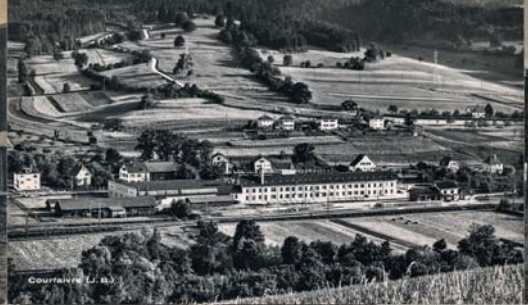
Courmayeur (L. 183)