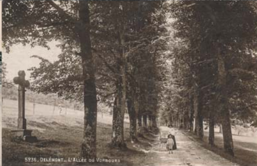
535. DELÉMONT... L'Allée ou Vorbourg