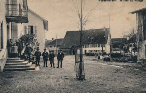
Reunion. Milieu du village