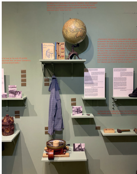
Objets personnels de Marc Chappuis illustrant son parcours de vie.

La scénographie de l'exposition et le montage de cette dernière ont été mises sur pied avec l'aide de l'Atelier Karma, agence de graphisme et de communication à Delémont.